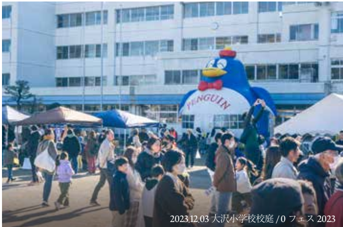
2023.12.03 大沢小学校校庭 / 0 フェス 2023

友人に恵まれ、自分達を成長させてくれた地元へ恩返しとして「生産者に感謝を伝えよう」をコンセプトにしたイベントを毎年日光市大沢で開催しています。