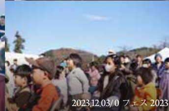
2023.12.03 / 0 フェス 2023