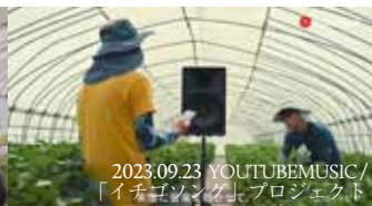
2023.09.23 YOUTUBEMUSIC / 「イチゴソング」プロジェクト