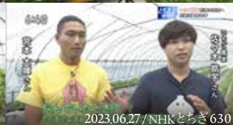
2023.06.27 / NHKとちぎ630