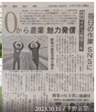
2023.10.15 / 下野新聞