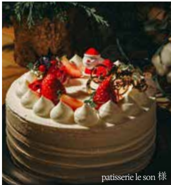
patisserie le son 様