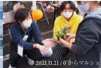
2021.11.21 / 0からマルシェ