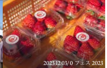
2023.12.03 / 0 フェス 2023