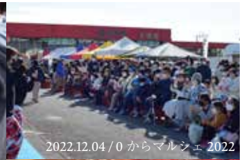
2022.12.04 / 0からマルシェ 2022