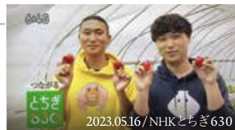
2023.05.16 / NHKとちぎ630