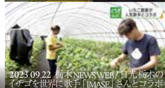
2023.09.22 栃木NEWSWEB / 日光栃木のイチゴを世界に歌手「IMASE」とコラボ